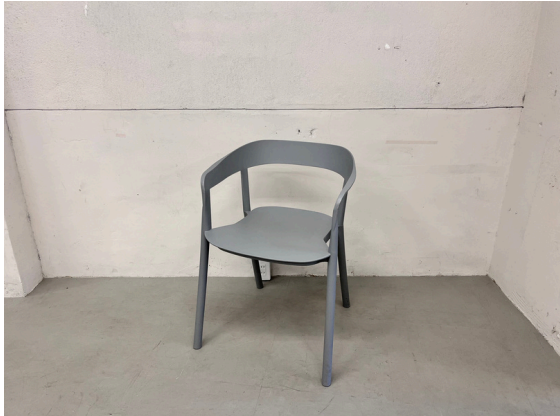
種別：チェア (A) 個数：2