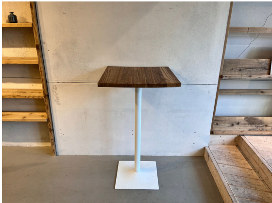
種別：ハイテーブル 個数：1 詳細：W :6 00mm xD :6 00mm xH :1 ,050mm