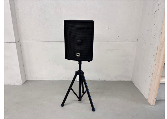
種別：スピーカー(マイク用) 個数：2 詳細：<要車前予約> ¥1,100 (税込) / 1回 ※マイクセットとして