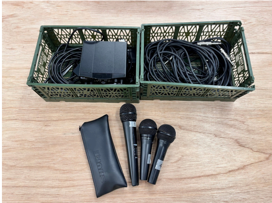
種別：マイク 個数：4 詳細：<要事前予約> ¥1,100 (税込) / 1回 無線x2 / 有線x2