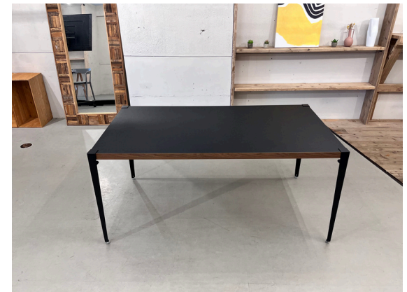
種別：テーブル 個数：3 詳細：W :1,820mm x D:910mm