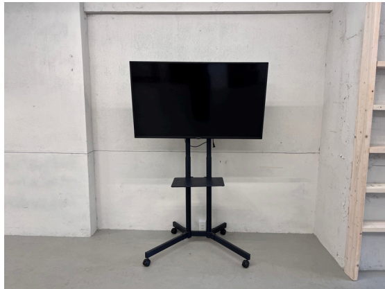
種別：モニター 個数：1 詳細：50 i nch