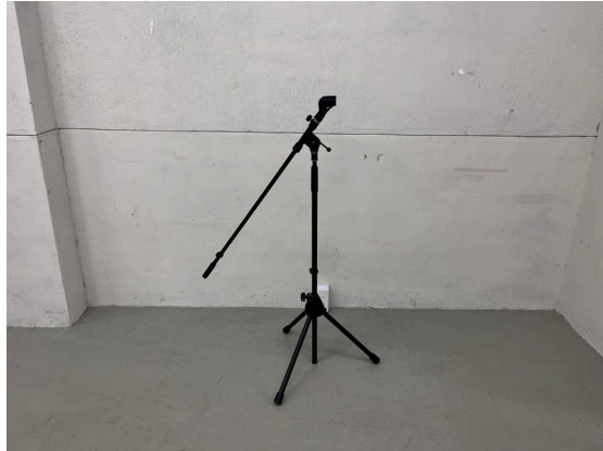
種別：マイクスタンド 個数：2 詳細：<要車前予約> ¥1,100 (税込) / 1回 ※マイクセットとして