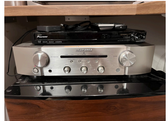
種別：オーディオ 個数：1 詳細：marantz PM5005