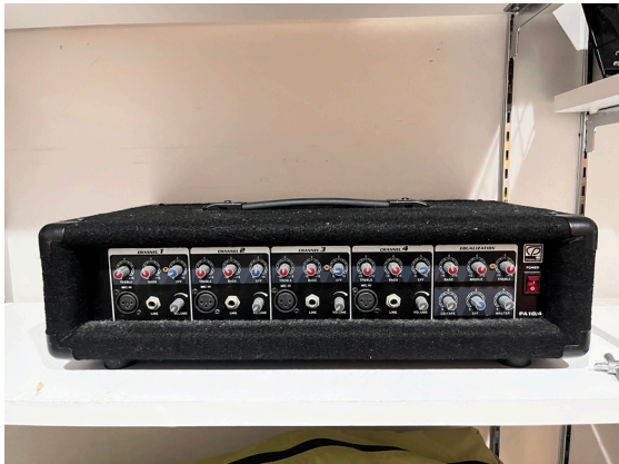
種別：マイクミキサー 個数：1 詳細：Class i cPro