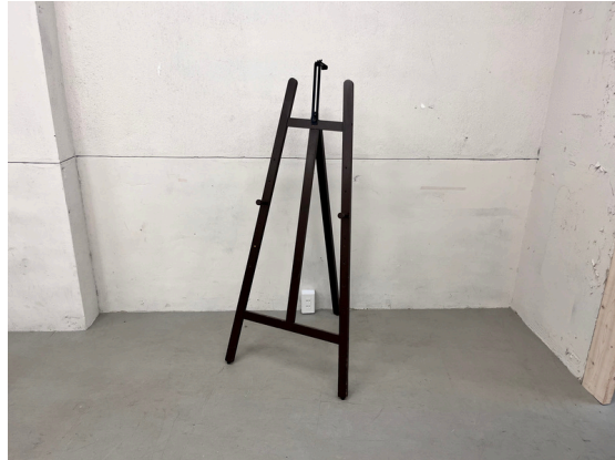
種別：イーゼル 個数：1