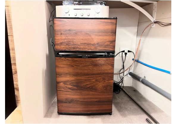
種別：冷蔵冷凍庫 個数：1 詳細：Haier JR-XP 1N4E-1