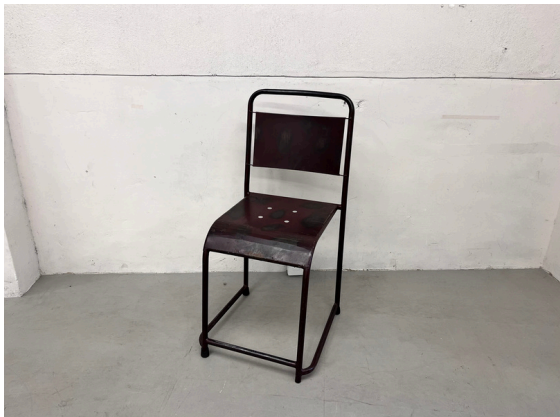
種別：チェア (D) 個数：1