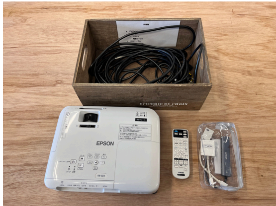
種別：プロジェクター 個数：1 詳細：EPSON EB-S04