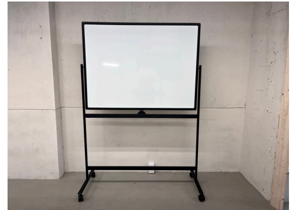
種別：ホワイトボード 個数：1 詳細：【ボード面】 タテ：900mmx ヨコ：1.200mm 高さ：1800mm