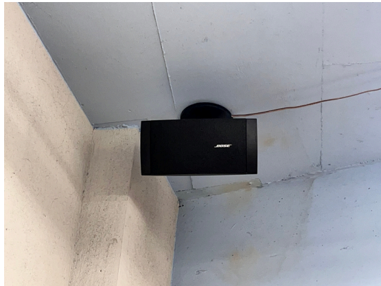
種別：スピーカー 個数：4 詳細：Bluetooth接続可