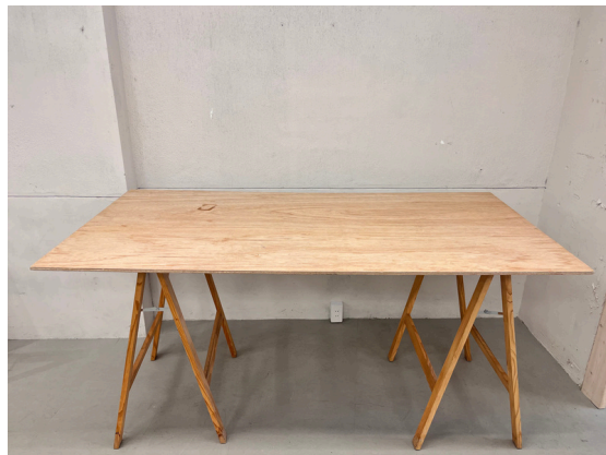
種別：合板天板 個数：2 詳細：W :1,800mm xD :800mm xH :700mm