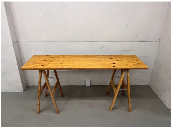
種別：テーブル（セパレートタイプ） 個数：6 詳細：W :1,500mm xD :445mm xH :700mm