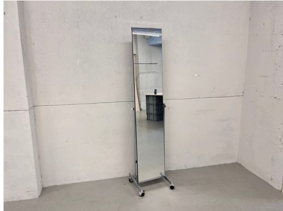
種別：姿見 個数：2 詳細：W1500 x H3000