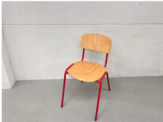
種別：チェア (E) 個数：4