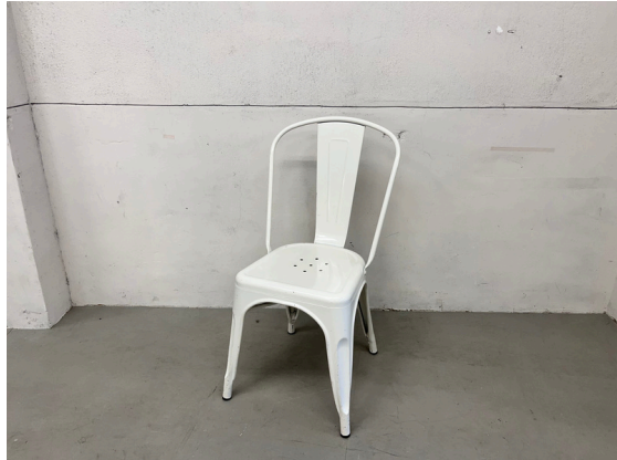
種別：チェア (B) 個数：2