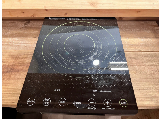
種別：IHヒーター 個数：1 詳細：D I-116