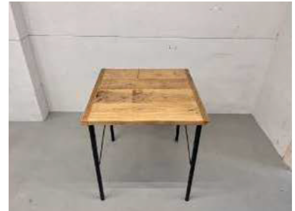
種別：スクエアテーブル 個数：2 詳細：W700 x D700 x H725