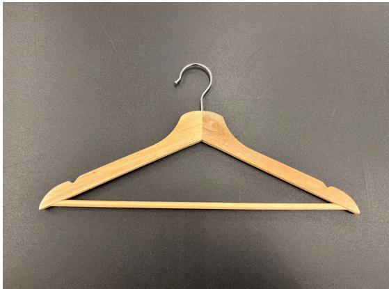
種別：シャツハンガー 個数：15