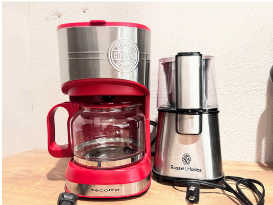
種別：コーヒーメーカー 個数：1