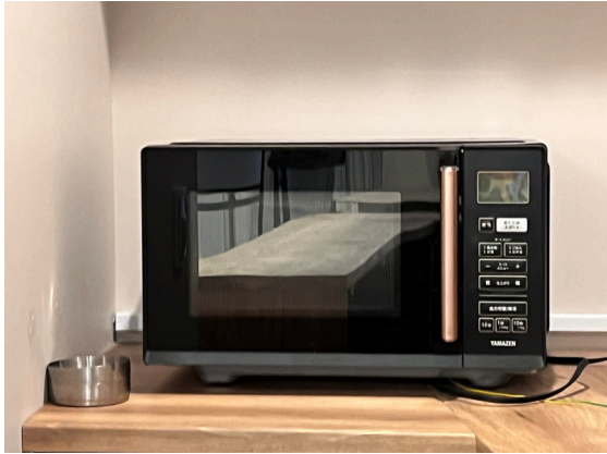
種別：電子レンジ 個数：1 詳細：YAMAZEN YRV-F230(B)