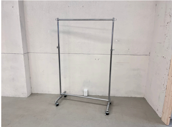
種別：ハンガーラック 個数：2 詳細：W900 x H900~1800(調整可)