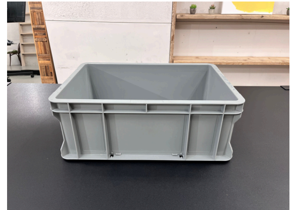
種別：コンテナ 個数：15