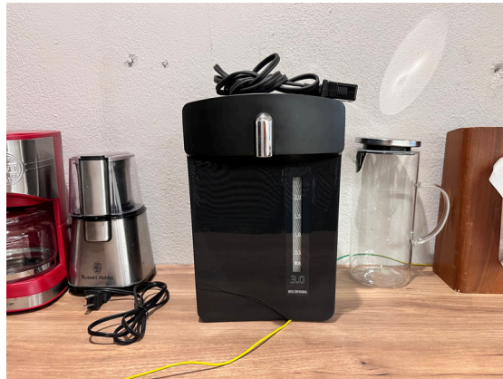
種別：電気ポット 個数：1 詳細：アイリスオーヤマ製