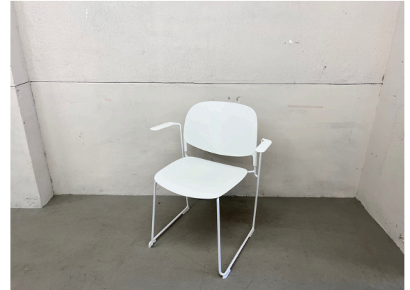
種別：チェア (C) 個数：2