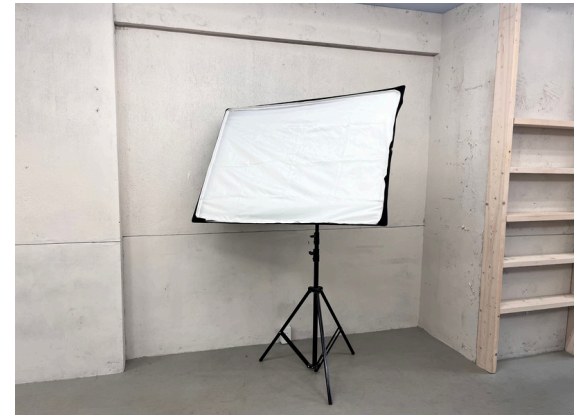
種別：ストロボ 個数：2 詳細：＜要車前予約＞ ¥2,200（税込） / 1回