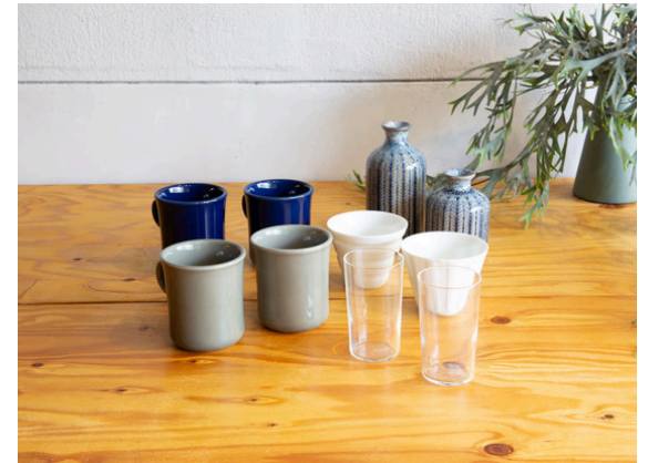
種別：コップ類 個数：複数