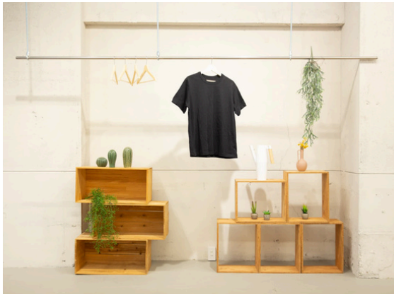
種別：吊りラック 個数：5 詳細：【要事前予約】1箇所につき：¥1,100(税込)