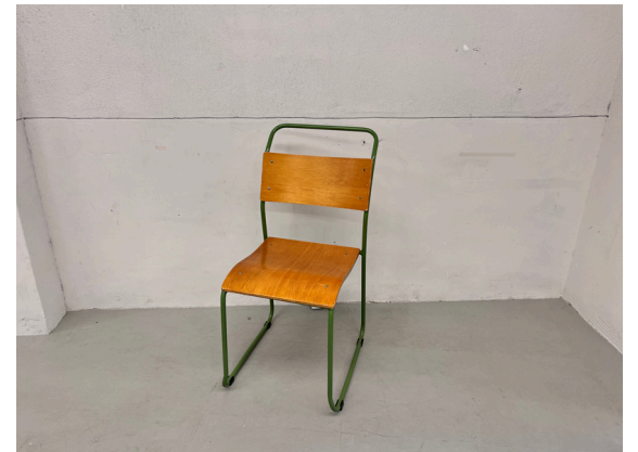
種別：チェア (F) 個数：1