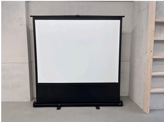
種別：スクリーン 個数：1 詳細：80 i nch