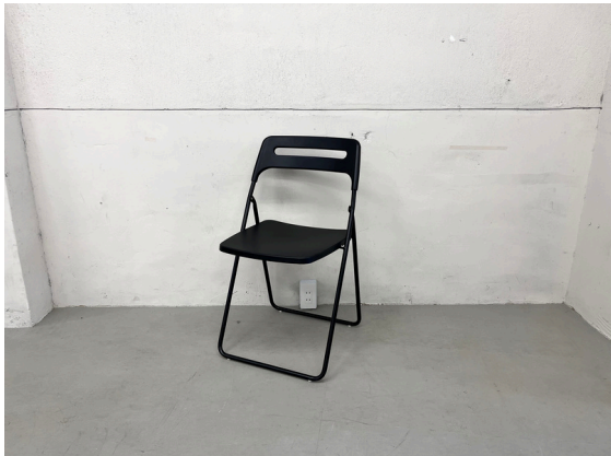
種別：折り畳みチェア 個数：16