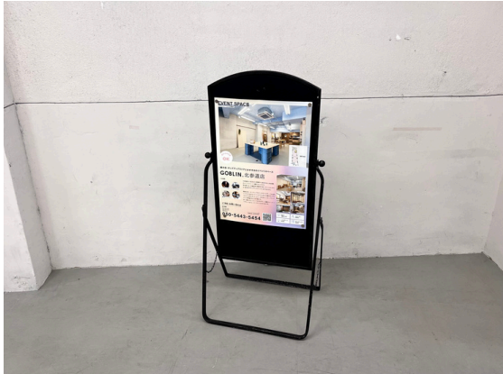
種別：アイアンボード 個数：1 詳細：【ボード面】W410 x D770