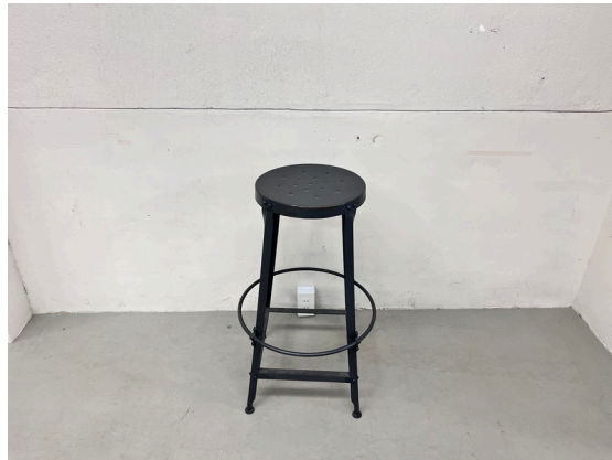
種別：ハイスツール 個数：2