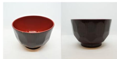
汁物碗 2 5