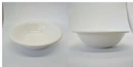
取分け用小皿（丸） 2 5