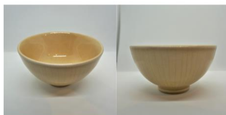
ご飯茶碗 2 5