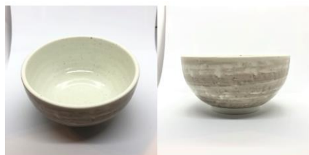
どんぶり 2 5