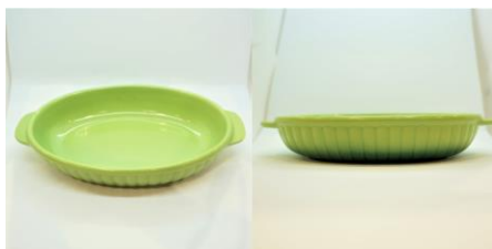
グラタン皿 2 5