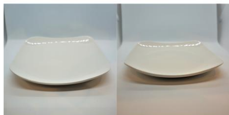
取分け用小皿（四角） 2 5