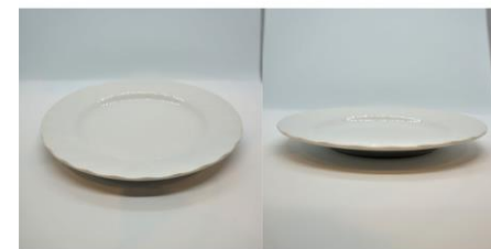
デザート皿 2 5