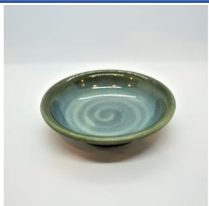
醤油皿 2 5